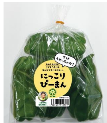
農総研のブランディング事例